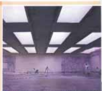
ON KAWARA. Una apuesta por el arte contemporáneo

En los últimos años ha ganado un gran reconocimiento. Su obra es un misterio. Su arte es un lenguaje que solo él entiende. Su trabajo es un desafío para los ojos de los demás.