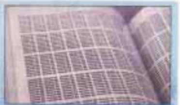
"On Kawara: 1924-1995" (ed. Jumea) por el artista