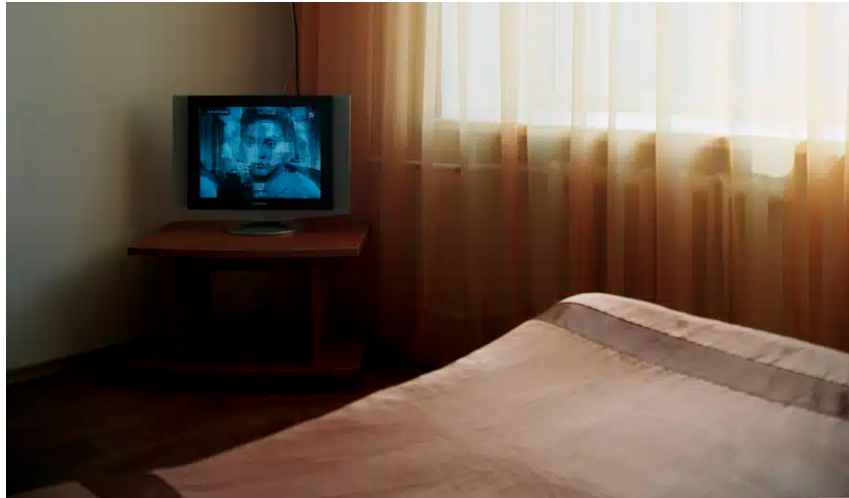
Ecran (Russie)

Il en découle pour les auteurs une « idéologie de la transparence » dont les implications politiques ne sont pas inexistantes. En nous focalisant sur ce qu'ils montrent, les écrans nous font oublier les algorithmes qui en sous-main règlent et biaisent les formes de la communication numérique : en prétendant s'identifier à l'ouverture , la « Transparence 2.0 » aspire en effet à se confondre avec l' immédiateté , un mot qui est compris à la lettre comme absence de toute médiation . Ainsi perçus, les médias numériques nourrissent l'illusion populiste que l'expression politique peut se manifester directement, au plus près de chacun, libérée de tout filtrage par des experts ou des représentants. Là où « les formes classiques de participation de la politique recouraient principalement à la parole pour élaborer la volonté collective et construire le consensus en son sein, aujourd'hui « l'organe du pouvoir populaire est le regard » ». Les écrans fonctionnent dès lors comme des miroirs : c'est par identification à l'« image » du leader que se construit l'opinion, et dans la méconnaissance que les outils de communication, loin d'être neutres, sont programmés et répondent à une série de choix qui dirigent leur usage.