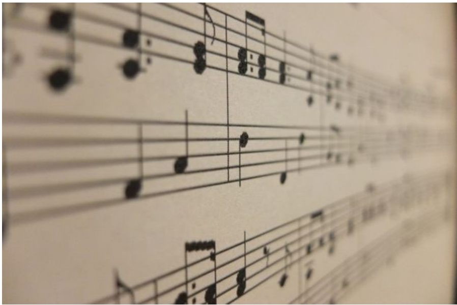
Partition, écriture musicale