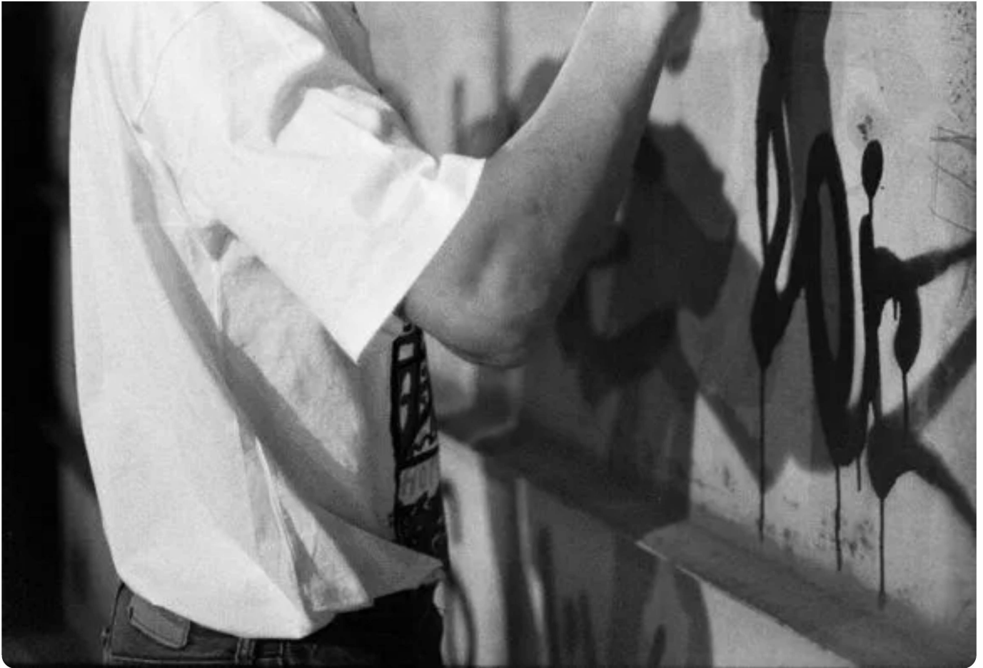
Joey Starr

Pendant plus de vingt ans, elle est retournée régulièrement à Brooklyn, dans le Bronx, dans Washington Heights et Harlem, construisant son corpus documentaire. Elle est aussi auteure de l'ouvrage Hip Hop Diary of a Fly Girl – 1986-1996 Paris et de All Eyes on Me (2025), des séries prolongeant un regard né dans la rue, entre portrait, mode et documentaire, mêlant profondeur sociologique et esthétique brute. Les vingt-six photographies présentées sur les grilles de la Tour Saint-Jacques sont issues de son long travail d'immersion dans un mouvement inspirant né des périphéries sociales.