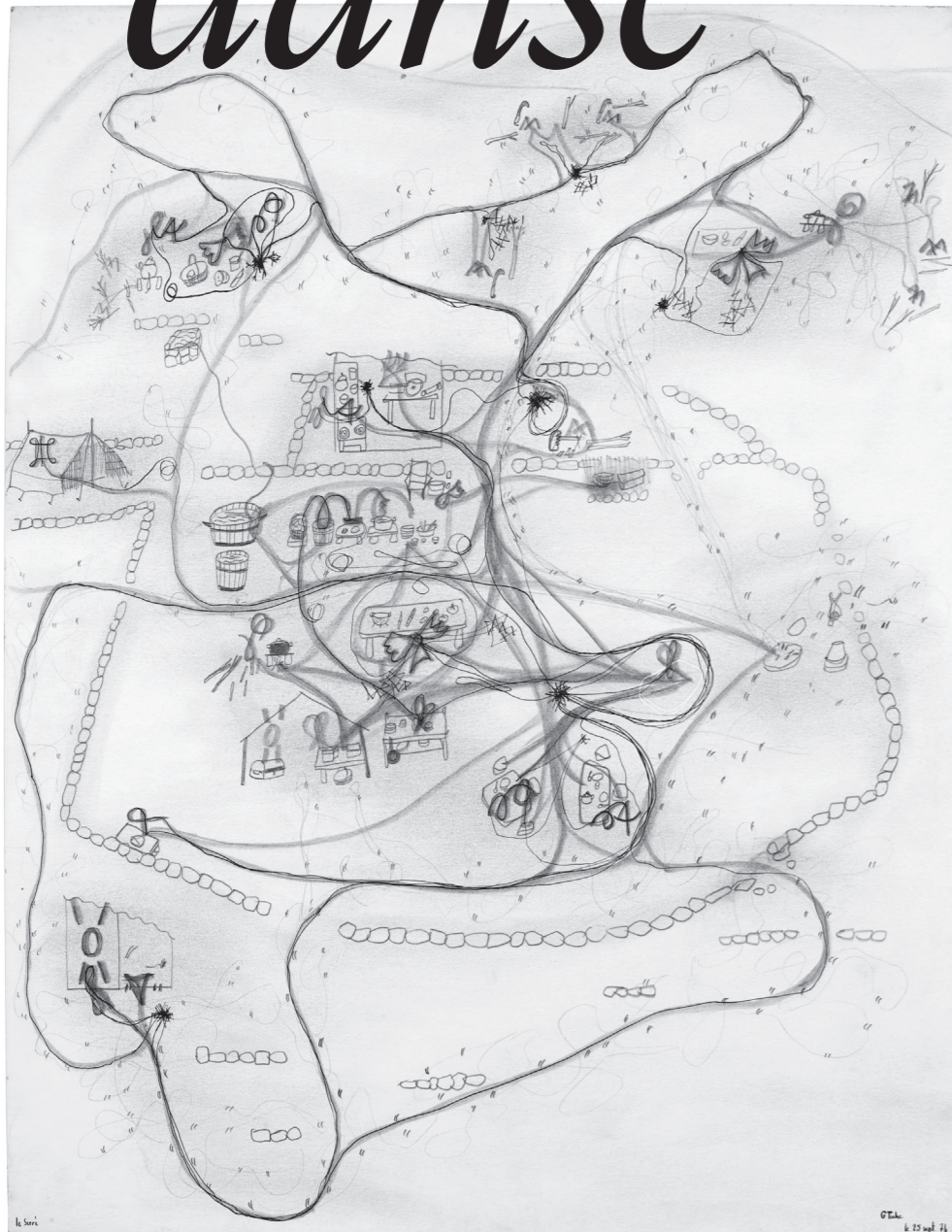
Le Serret, 25 septembre 1974, carte tracée par Jacques Lin 63 X 52 cm