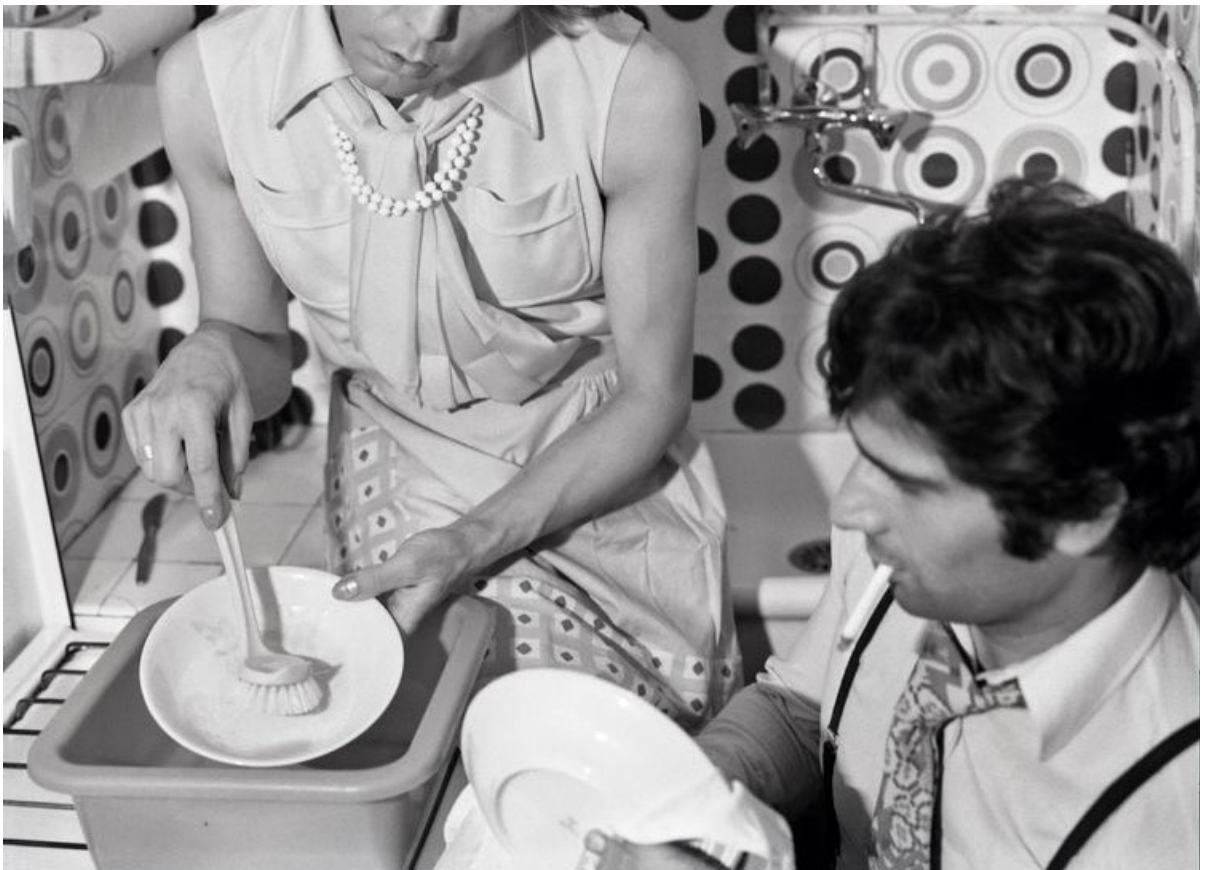
La Vaisselle . Photo extraite de «Réalités», série «24 heures dans la vie d'une femme ordinaire».

Mais la femme de 1974, vue et interprétée par Journiac, paraît coincée entre des injonctions contradictoires : celle que lui dicte son rôle d'épouse, celle de cheville ouvrière des Trente Glorieuse mais aussi celle que lui souffle son inconscient habité de fantasmes – Journiac l'écrit «Phantasmes». La dame se rêve aussi en putain, en mariée, en cover girl, en veuve, en lesbienne et imagine avec délices l'arrivée d'un playboy sauveur ou d'un bébé suceur de téton. Et pourquoi ne se rêverait-elle pas aussi en objet sexuel qu'un homme voudrait enlever sur une grosse cylindrée voire violer ? Des fantasmes sexuels dit féminins, sortis d'un imaginaire seventies et que l'on voit aujourd'hui avec un regard tout autre.