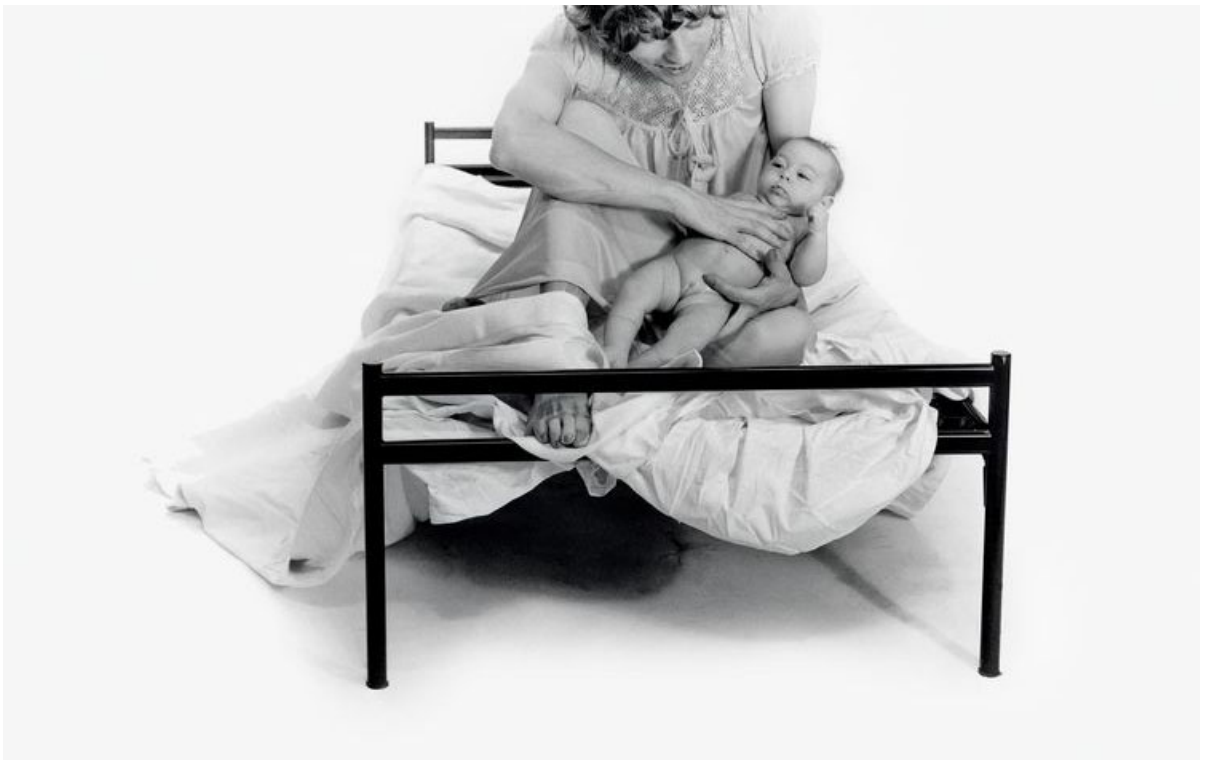
La Maternité. Photo extraite de «Phantasmes», série «24 heures dans la vie d'une femme ordinaire».

Le Corps travesti ne serait pas aussi remarquable s'il n'était augmenté de textes fouillés et introduit par Paul B. Preciado. Pour Preciado, le travestissement pratiqué par Michel Journiac n'est pas seulement une parodie de la femme ordinaire des années 70. Il est aussi une action de travestissement pour lui-même, un manifeste pour un corps neuf, débarrassé des questions de genre (« le travesti envoie chier votre différence sexuelle et vos pronoms masculins et féminins et vos familles, vos papiers d'identité, vos passeports et vos permis »). Ainsi, puisque le travesti est « l'aboutissement d'un processus digestif colonial et patriarcal millénaire », toujours selon Preciado, «24 heures dans la vie d'une femme ordinaire» est forcément une merde rare, brandie par le sorcier Journiac. La galerie présente en parallèle de ce livre un solo show de l'artiste à Paris Photo avec 36 tirages vintages de cette fameuse série.