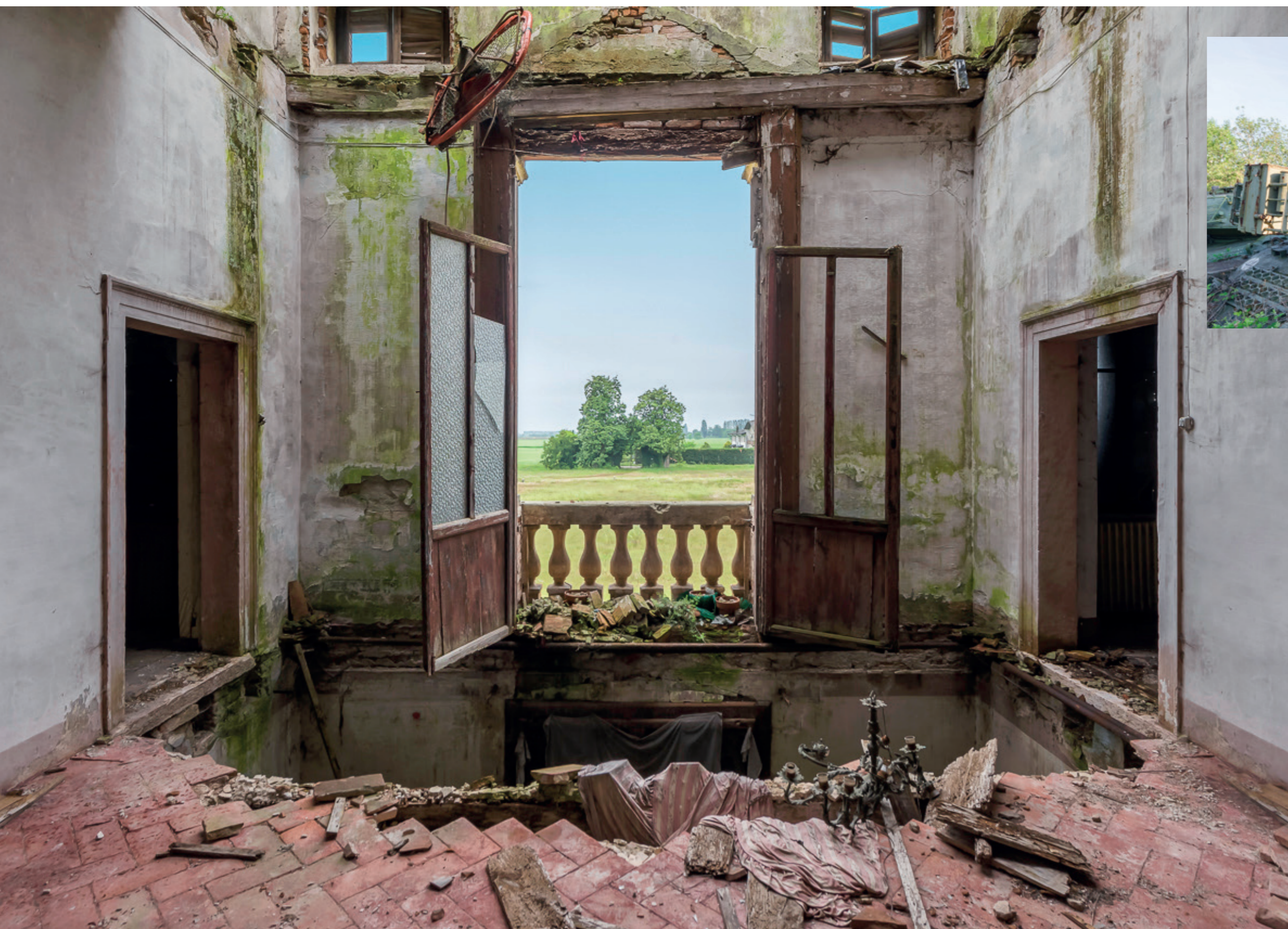
«Chérie va fermer la fenêtre !». Palais abandonné, Italie 2017. Cet ancien palais ne sert plus gère aujourd'hui que de dépôt pour les engins agricoles. Dans cette pièce pourtant subsiste la trace de ce qu'était la vie autrefois avec cette vue imprenable et cette fenêtre grande ouverte comme une invitation.