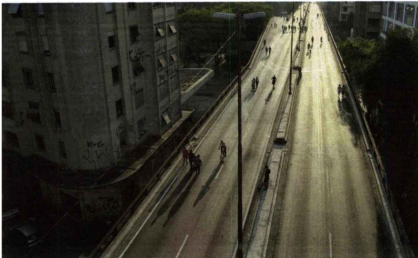
Above and Below the Minhocão (2014) montre comment cette artère de béton de São Paulo devient lieu de promenade, le week-end.

se soustraient au rythme ininterrompu du néolibéralisme, au régime du 24/24 théorisé récemment par l'essayiste américain Jonathan Crary dans 24/7 (éd. La Découverte).