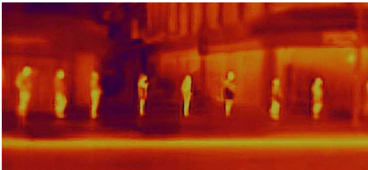
Antoine d'Agata, Virus.