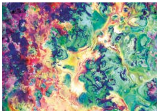
Maya Rochat, «Language of Color (Les frontières sont des dessins 2D)», 2022.