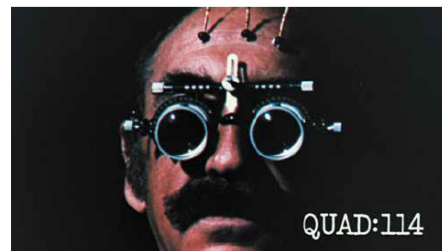
Saul Bass dans Phase IV , fin originale.