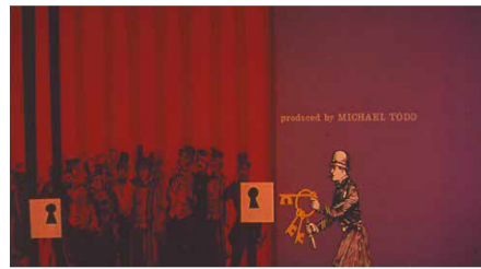
Titrage pour Around the World in 80 Days [Le tour du monde en 80 jours], 1956.