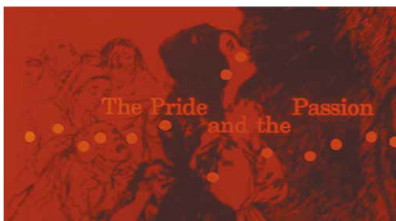
Titrage pour The Pride and the Passion [Orgueil et Passion], 1957.