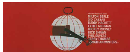
Titrage pour It's a Mad, Mad, Mad, Mad World [Un monde fou, fou, fou, fou], 1963.