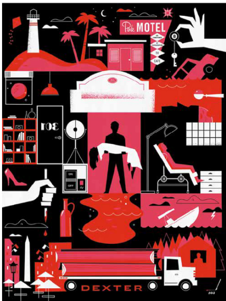
Dexter saison 8, affiche conçue par Ty Mattson. (Courtesy of Ty Mattson)